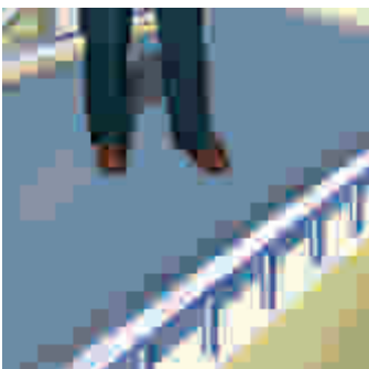
Sikafloor®-400 N Elastic + szybko wysycha i po krótkim czasie może być eksploatowany