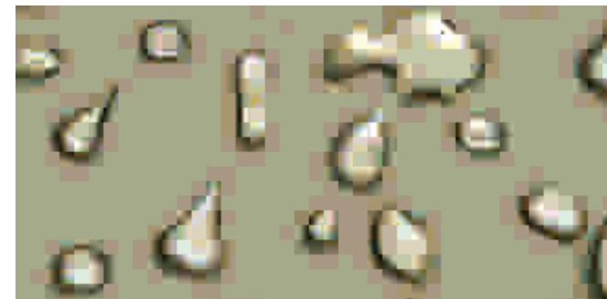
Sikafloor®-400 N Elastic + stanowi wodoszczelną warstwę