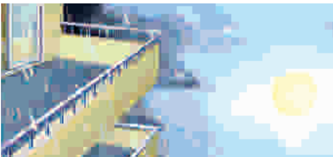
Sikafloor®-400 N Elastic + jest trwały i odporny na warunki atmosferyczne