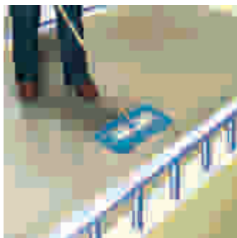
Odporny na tłuszcze i zabrudzenia. Prosty w czyszczeniu

Wodoszczelna powłoka elastyczna na balkony, tarasy i schody